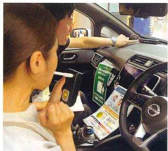
アルコールインターロックを体験する参加者

この装置を実用化している運送業者等がいる一方で、「個人」には、まだ認知度は低いと言わざるを得ない現実があります。 飲酒運転ゼロを実現するための究極的手段として、「車を動かなくさせる装置」飲酒運転できない車をつくる」という熱意に、技術者たちの本気度を感じます。 昨年十月、韓国でも飲酒運転の常習違反者を対象にアルコールインターロックが義務化されました。 「飲酒による痛ましい事故をゼロにするため、今後さらに、この装置の認知度を高め、もつと普及させていきたい」との、東海電子担当者の決意に、私たちも大いに期待し、協力していきたいと思えます。