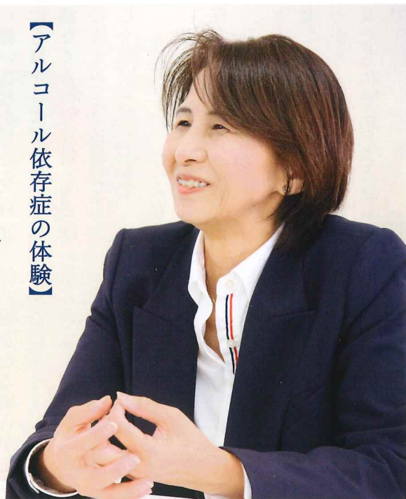
【アルコール依存症の体験】